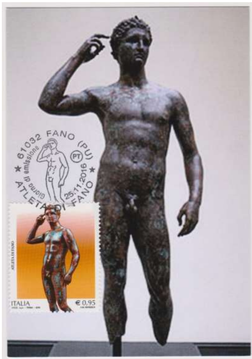
Patrimonio Artist.Italiano Atleta di Fano Em.25-11-2016 Italia ASI-I°G Fano Ed. Priv.