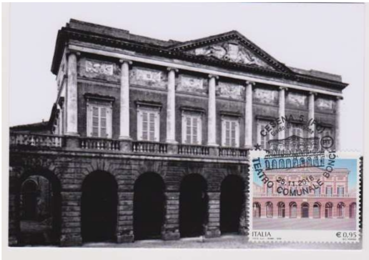
Patrimonio Artist.Italiano Teatro Comunale Bonci Cesena Em.25-11-2016 Italia ASI-I°G Cesena Ed. Priv.