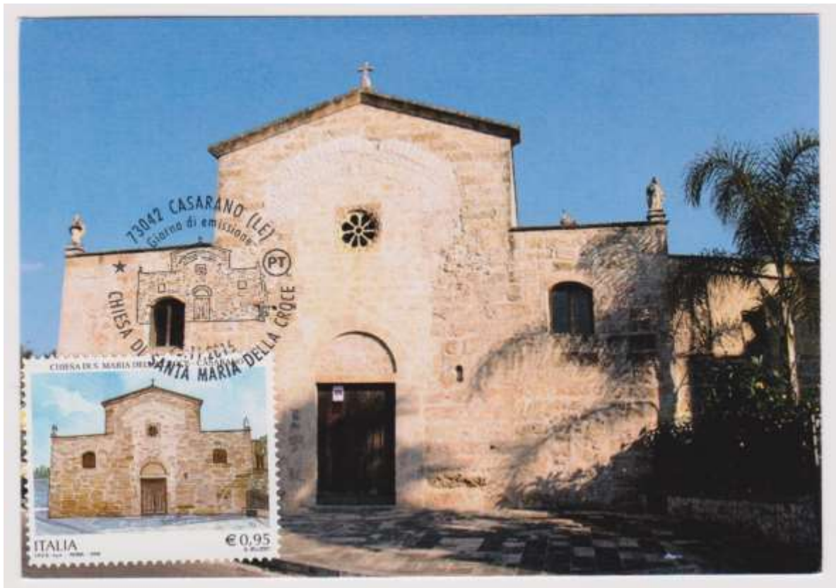
Patrimonio .Artist.Italiano S.Maria della Croce- Casarano Em.25-11-2016 Italia ASI-I°G Casarano Ed. Priv.