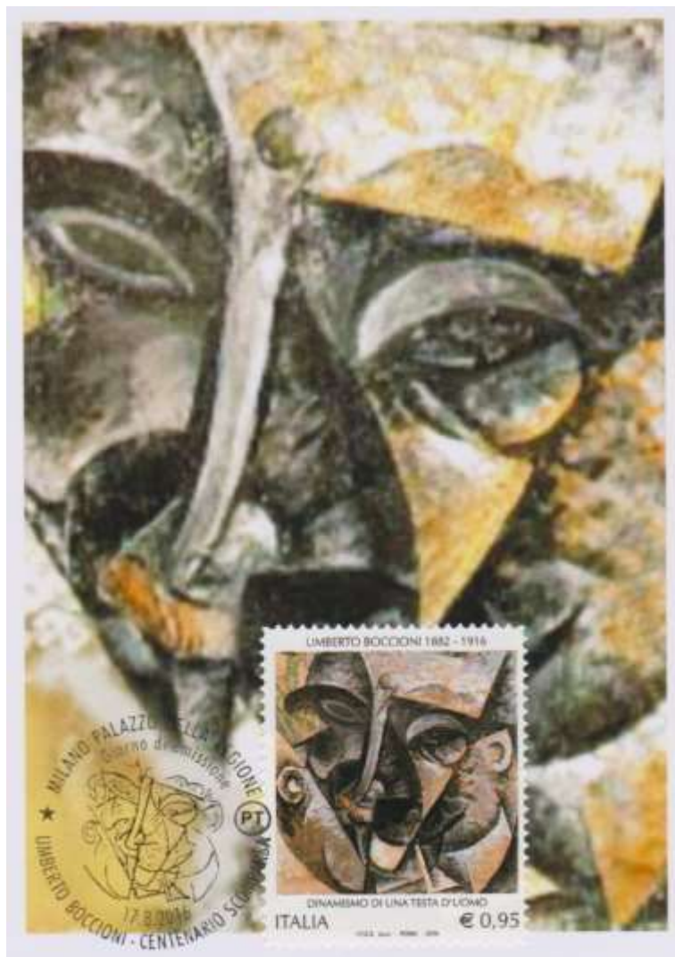
Cent. Morte U.Boccioni Dinamismo Testa d'uomo Em.17-08-2016 Italia ASI-I°G Milano Ed. Priv.