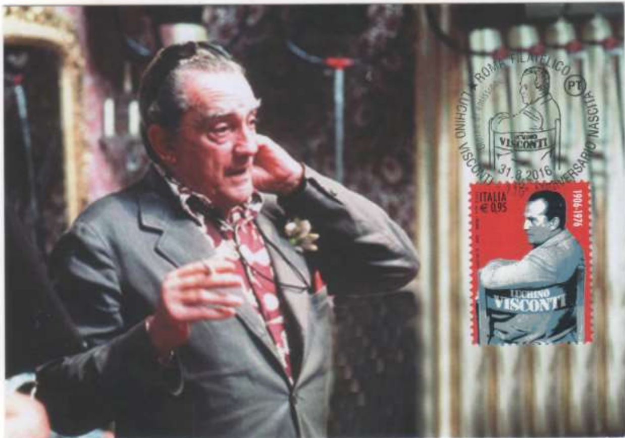
110 anniversario nascita Luchino Visconti Em. 31-08- 2016 Italia ASI – I°G Roma Ed. Priv.