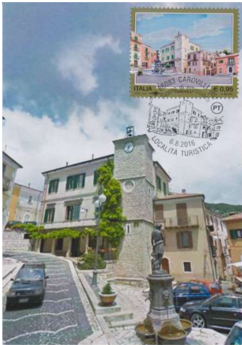
Serie Turismo:Carovilli P.zza Municipio,Torre Civica Fontana di Bacco Em.06-08-2016 Italia ASI-I°G Carovilli Ed.comm