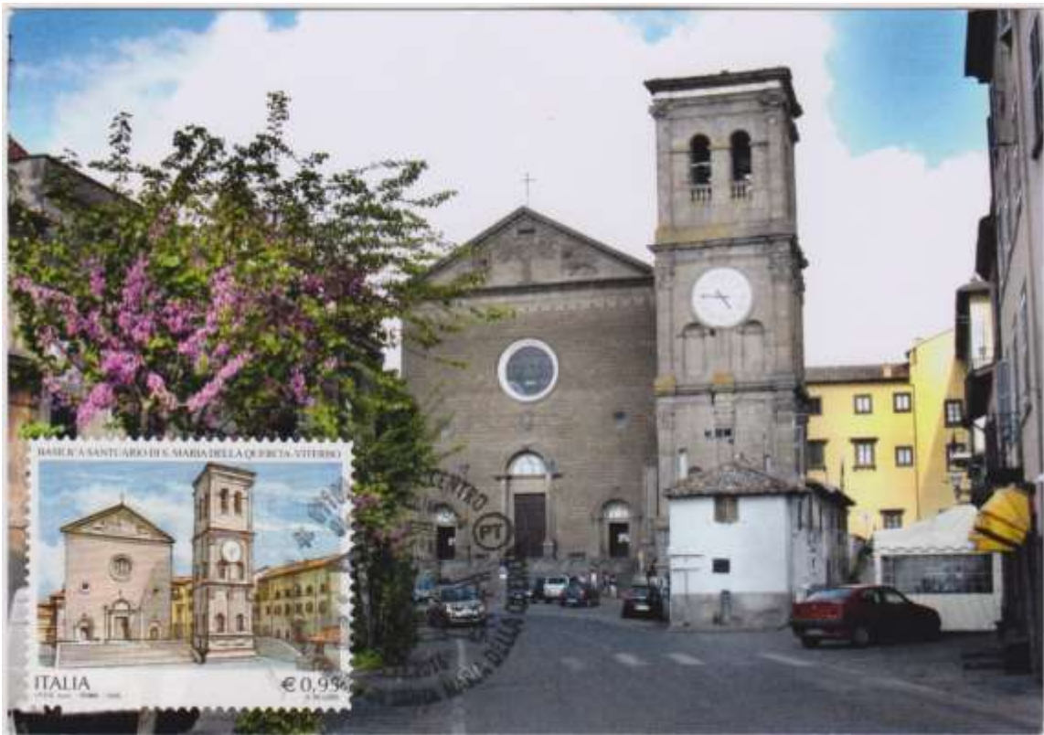
Patrimonio Artist.Italiano Bas. S.Maria della quercia Viterbo Em.25-11-2016 Italia ASI-I°G Viterbo Ed. Priv.