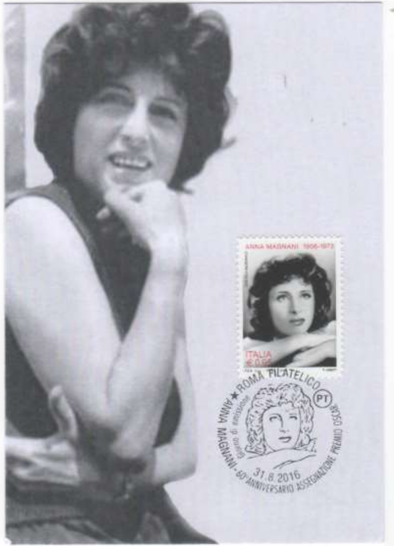
60° Anniversario dell'assegnazione del Premio Oscar ad Anna Magnani Em. 31-08-2016 Italia ASI – I°G Roma Ed.Priv.