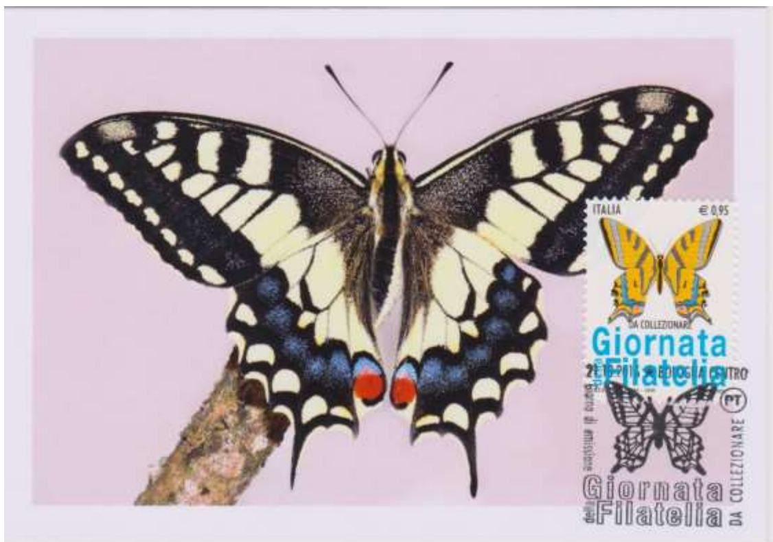
Giornata della Filatelia Papillon Machaon Em.21-10-2016 Italia ASI-I°G Bologna Ed.Priv