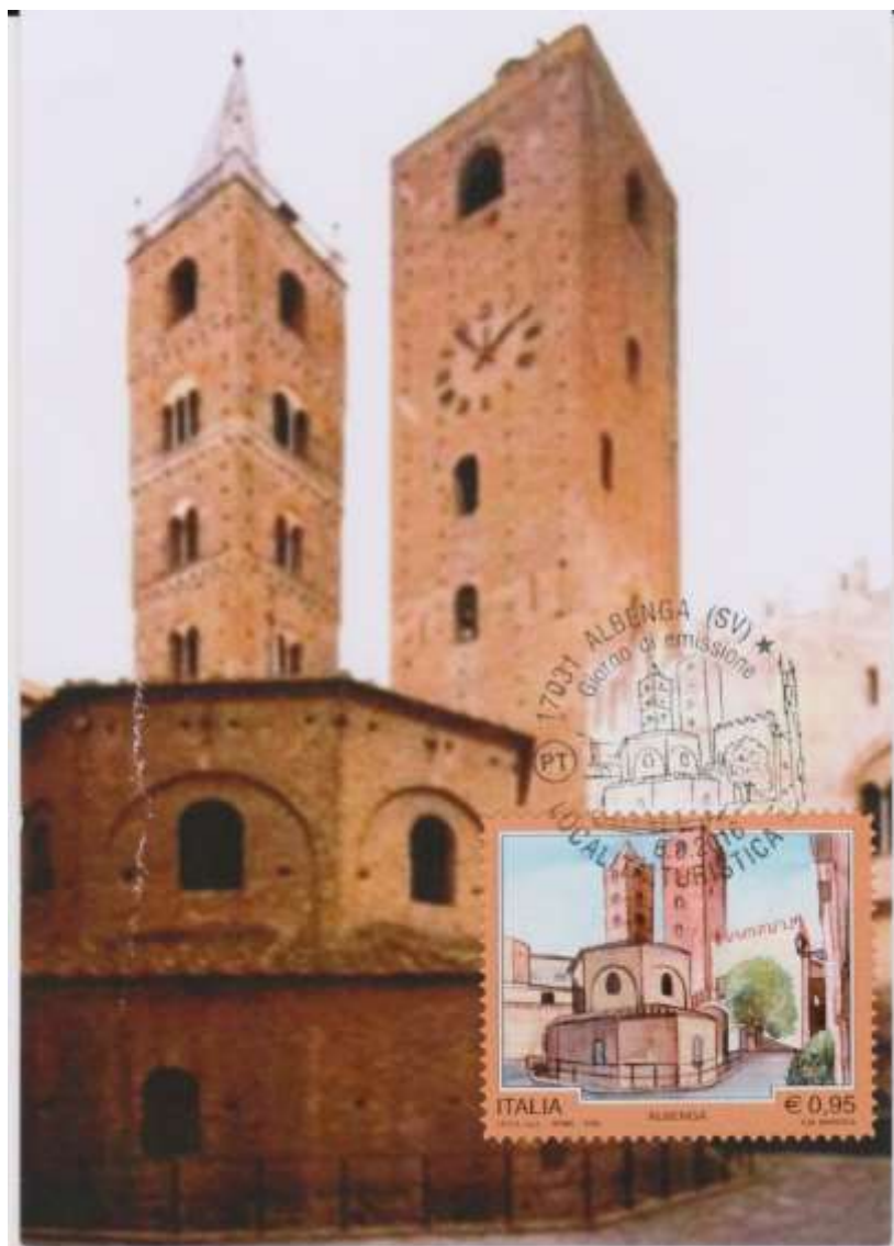
Serie Turismo:Albenga Battistero e Chiesa di San Michele arcangelo Em.06-08-2016 Italia ASI-I°G Albenga Ed.comm