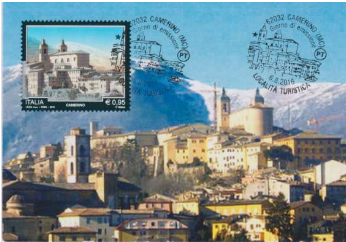
Serie Turismo:Camerino Panorama con Cattedrale di Santa Maria Annunziata Em.06-08-2016 Italia ASI-I°G Camerino Ed.comm