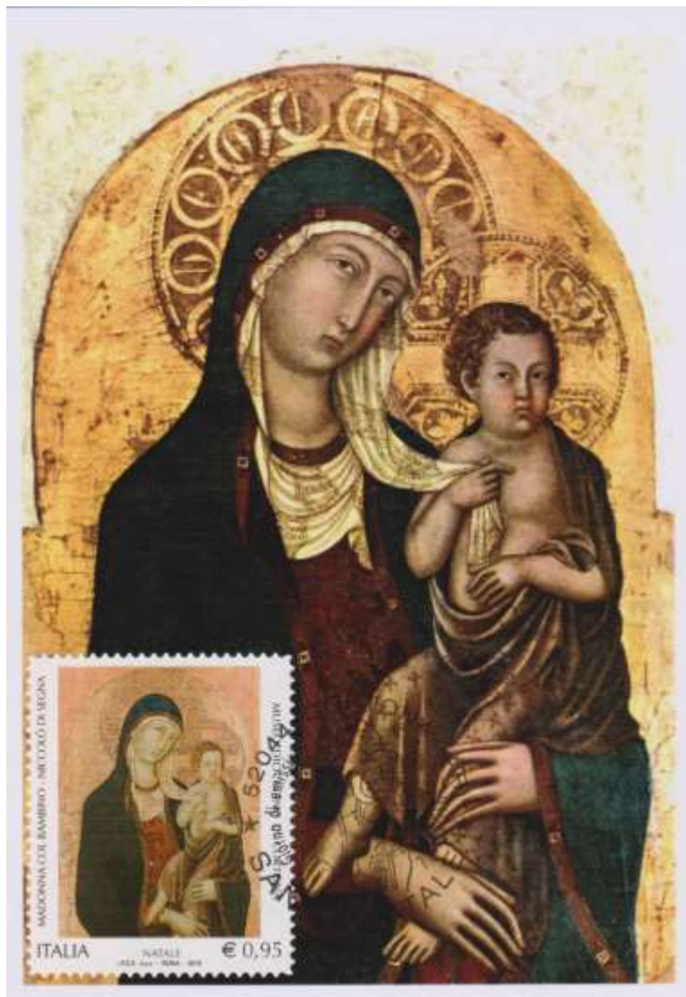
Madonna con Bambino di Nicolò di Segna Em.07-12-2016 Italia ASI-I°G Cortona Ed. Priv