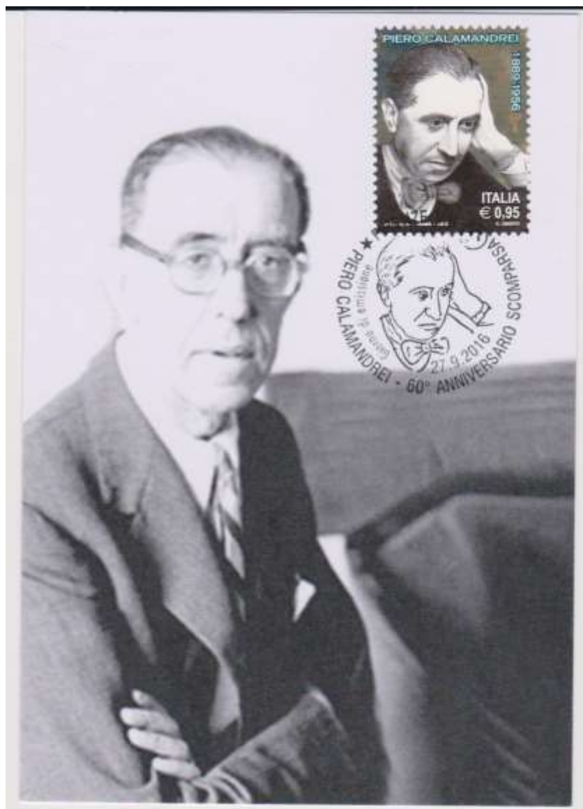
60° Anniversario Morte di Piero Calamandrei: politico, giurista e scrittore Em. 27-09-2016 Italia ASI – I°G Firenze V.R.