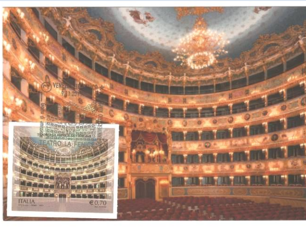
Fig.2 Em.09-11- 2013 Italia Obl. 09-11-2013 Venezia Giorno di emissione Valid. Illimitata

La concordanza di luogo è data dal fatto che essendo il Pontefice una figura Universale, il francobollo è emesso dall'Italia e l'Annullo è avvenuto Roma. La concordanza di tempo è determinata dal fatto che il francobollo è stato annullato