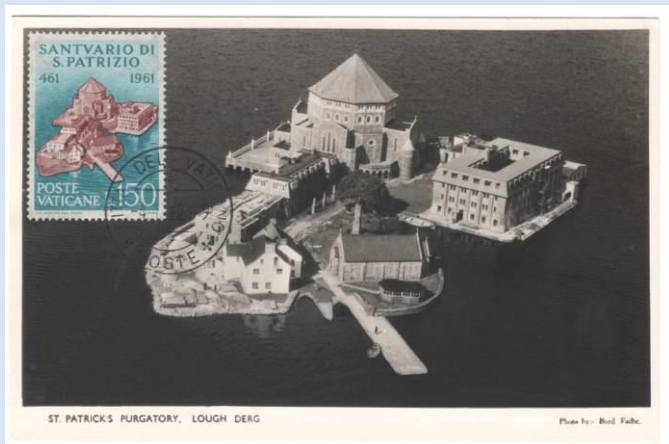
Fig.3 Em. 06-10-1961 Stato:Città del Vaticano Obl. 08-11-1961 Stato Città del Vaticano Santuario di San Patrizio – Isola del Purgatorio- Irlanda

La concordanza di luogo non è soddisfatta poiché il monastero si trova in Irlanda, e non nello Stato del